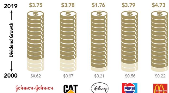
Changement de dividende / part

Basé sur la fin de l'exercice fiscal.